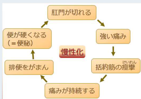
裂肛が悪循環となるサイクル